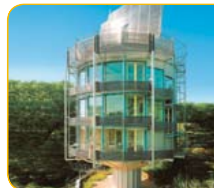
Das rotierende Solarhaus „Heliotrop“