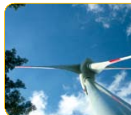
Die Nutzung von Windenergie im Schwarzwald

Anmeldung unter: www.local-renewables2007.org