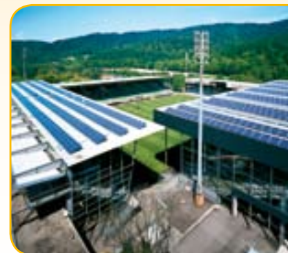
Die Solaranlage auf dem Freiburger badenova-Stadion